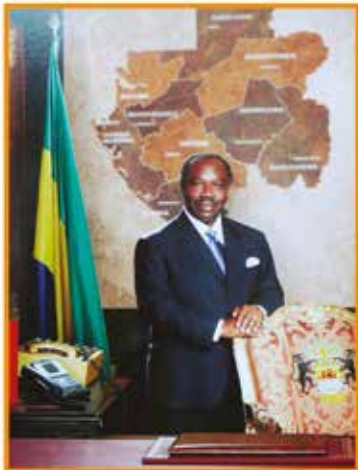
S.E. ALI BONGO ONDIMBA Président de la République Gabonaise Chef de l'Etat