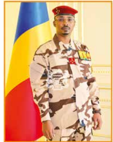
Général de corps d'armée MAHAMAT IDRIS DEBY ITNO Président du Conseil Militaire de Transition, Président de la République, Chef de l'Etat مبارك وان محمد ايدريس ايتنو رئيس المجلس العسكري الانتقالي - رئيس الجمهورية رأس البوتانا