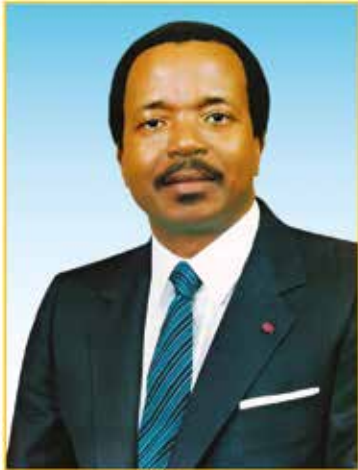
S.E. PAUL BIYA Président de la République du Cameroun