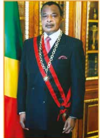
S.E. DENIS SASSOU N'GUESSO Président de la République du CONGO