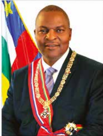
Pr Faustin Archange TOUADERA Président de la République Chef de l'Etat